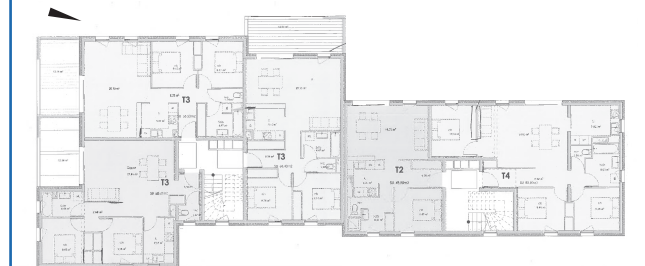
Plan du R+1 - © GDH

Le projet bénéficie d'une grande proximité avec le centre-bourg grâce à une liaison piétonne qui traverse le jardin de la chapelle Sainte-Croix pour rejoindre le centre. Cela participe grandement à l'extension de l'aire de centralité villageoise.