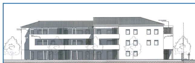
Façade Ouest - © Extrait du dossier de PC. Mairie de Ste-Cécile-les-Vignes

Les logements du RDC côté Ouest bénéficient de jardinets en prolongement des espaces de vie.