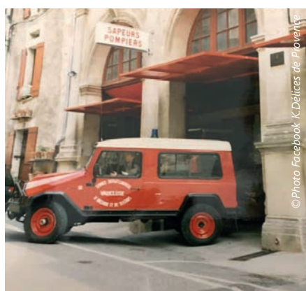
Vue de l'ancienne caserne de pompiers avant reversion

L'opération présente une mixité fonctionnelle par l'aménagement de 4 logements et de 2 locaux commerciaux qui participent à conforter l'animation villageoise.