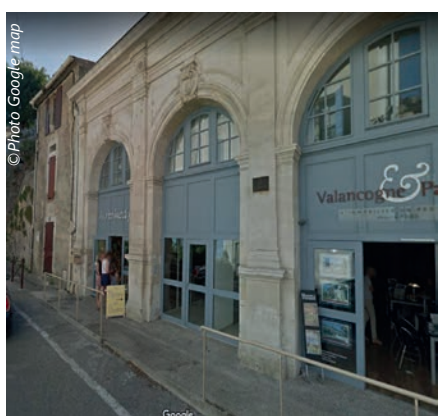
Façade principale après reversion montrant les deux commerces sur les travées latérales et l'accès aux logements sur la travée centrale