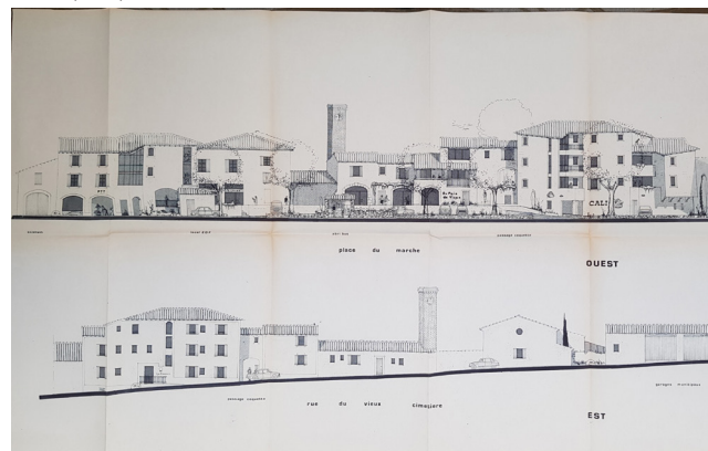
© Plan Est/Ouest extraites du dossier du PC. Mairie de Visan.